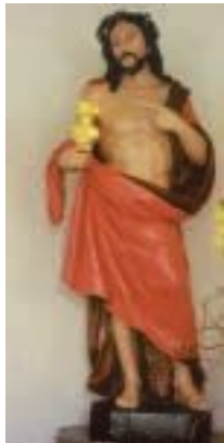
Petershausen, Wies-Kapelle. Herz-Jesu-Figur

Innen überrascht den Besucher die seltene Darstellung eines Schmerzaftigen Heilands, der mit seiner Linken auf die rechte Schulterwunde zeigt. Diese ikonographische Besonderheit des „Schulterwundenheilands“ ist selten in Oberbayern anzutreffen und war Anlass für viele Wallfahrten hierher. Da die Figur 1724 in Freising angefertigt wurde, kommt als Meister der damals dort lebende Bildhauer Johann Christoph Thalhammer (1676–1728) in Frage. Später wurde der Christusfigur ein Flammenherz in die rechte Hand gegeben und damit in neuerer Zeit die Verehrung auf „Herz-Jesu“ umgedeutet. Am Chorbogen heißt es dementsprechend „Hl. Herz Jesu, erbarme dich unser“.