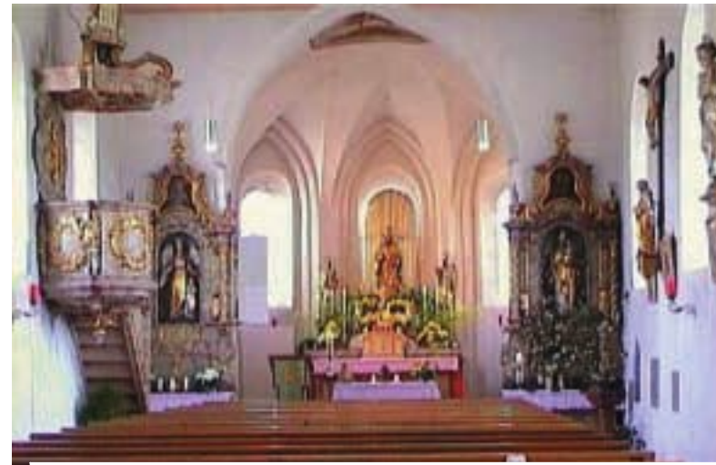
Kollbach, St. Martin. Innenansicht

Die Pfarrkirche erhielt Ende des 19. Jh. eine vollständige neuromanische Einrichtung und 1895 eine Ausmalung von Eduard Müller, München. Dabei beließ man vom ehemaligen Hauptaltar im Chor nur mehr das Antependium (Verkleidung der Altarvorderseite) in seiner ursprünglichen Form. Seitlich des Tabernakels knien zwei spätbarocke Anbetungselgen. Hinter dem Altar sind drei Heiligenfiguren angebracht: In der Mitte eine größere Darstellung des Kirchenpatrons, des