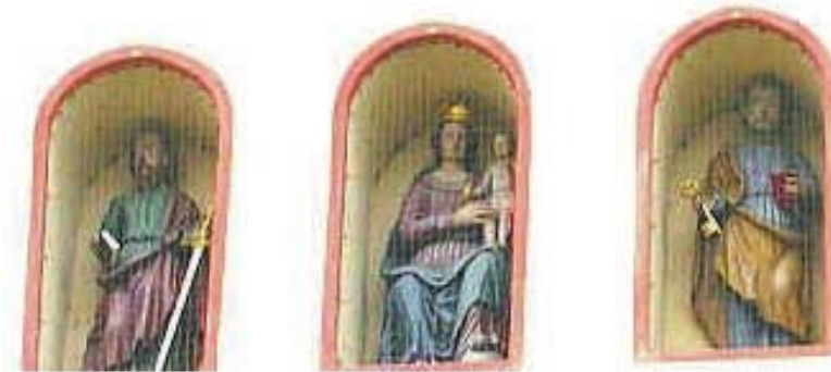
Asbach, St. Peter und Paul. Skulpturen im Turm

Auffallend an der Chorturmseite unter dem barocken Überbau sind die drei rundbogigen Mauernischen mit den Skulpturen der Hl. Petrus, Maria und Paulus. Das ehemalige Südportal mit seiner kräftigen barocken Portalarchitektur ist vermauert und beherbergt heute das Kriegerdenkmal. Die Kirche betritt man deshalb vom später angebauten westlichen Vorzeichen (Eingangsbereich) her. An der Langhaussüdwand und am unteren Turmteil finden sich romanische Blenden mit Rundbogenfriesabschluss. Behäbig trägt der achteckige barocke Turmoberbau