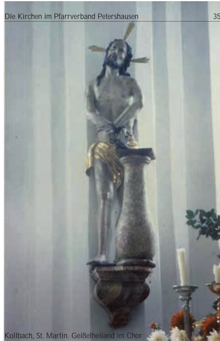
Kollbach, St. Martin. Geibelheiland im Chor