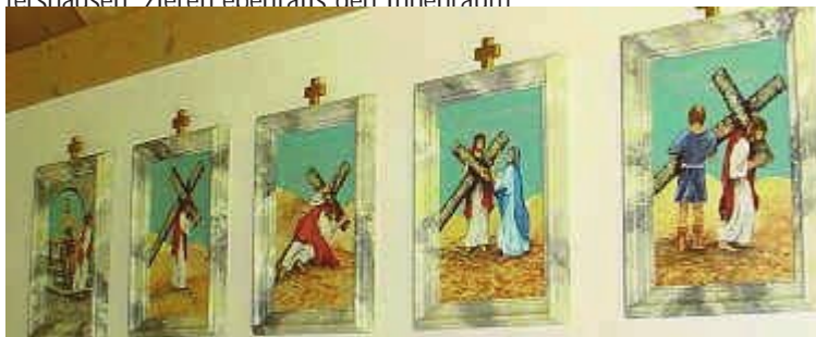
Ziegelberg, St.-Josefs-Kapelle. Kreuzwegstationen