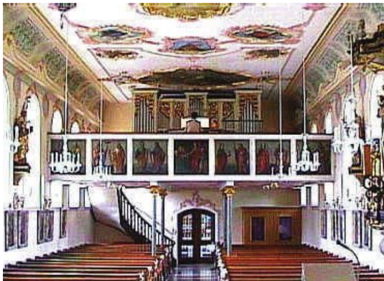
Petershausen, St. Laurentius. Innenansicht

Die Empore stammt aus der Zeit um 1891. Sie ruht auf vier Säulen. Der reiche Neorokokostuck an der Unterseite wurde von Leander Weipert, München 1890, gefertigt. An der Brüstung sind Apostelgemälde des 18. Jh. in paarweiser Reihenfolge zu sehen: Judas Thaddäus und