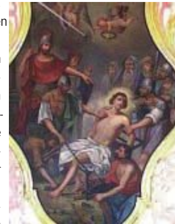
Petershausen, St. Laurentius. Deckengemälde mit dem Hl. Laurentius

Im Innenraum finden wir einen flach gedeckten Saalbau mit eingezogenem, ebenfalls flach gedecktem Chor, vor, jeweils mit Hohlkehle profiliert. Ungewöhnlich ist der reiche Stuck, meist Neurokoko, von Leander Weipert, München 1890, der wahrscheinlich an den Altbestand im Chor aus der Frührokokozeit angepasst wurde. Im Chor stellt das Deckengemälde das Martyrium des Kirchenpatrons dar, entstanden wohl