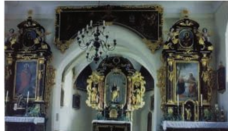
Kollbach, Frauenkirche. Innenansicht

Die hochbarocken Altäre mit ihren kräftigen Knorpelwerkschnitzereien im Stil der Zeit um 1675 zeigen sich in einer Schwarz-Goldfassung. Der Choralter ist tektonisch mit zwei Wendelsäulen gestaltet. Im Zentrum betrachten wir das Gandenbild Mariens mit nacktem Kind in ihrer Linken. Sie steht auf einem Gewölk, wobei der rechte Fuß auf einer Mondsichel ruht. Das Gemälde ist eine Neuanschaffung von 1974 in einem Rahmen mit oben und unten gerundeten Ecken. Als As-