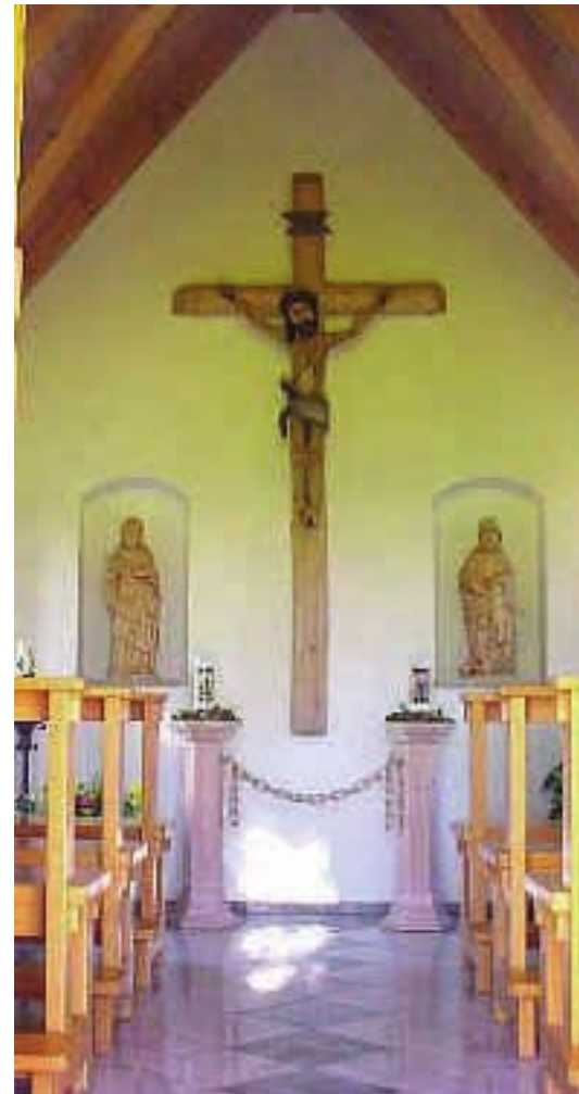
Ziegelberg, St.-Josefs-Kapelle. Innenansicht

Im Turm hängt eine Glocke, von Glockengießermeister Gugg aus Straubing gegossen.