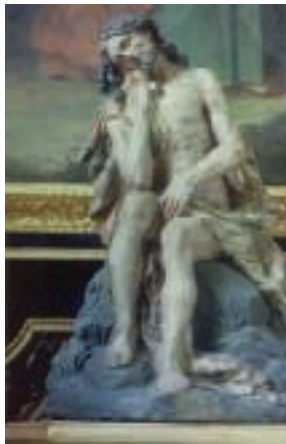
Kollbach, Frauenkirche. Christus in der Rast.

Die Empore aus der 2. Hälfte des 17. Jh. ist reich verziert, aber im ungefassten Holzton gehalten. Das hochbarocke Chorgestühl ist be-