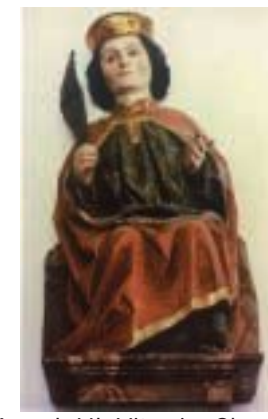
Obermarbach, St. Vitus. Linker Seitenaltar. Kanzel. Hl. Vitus im Chor