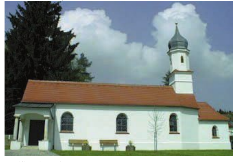
Weißling, St. Notburga