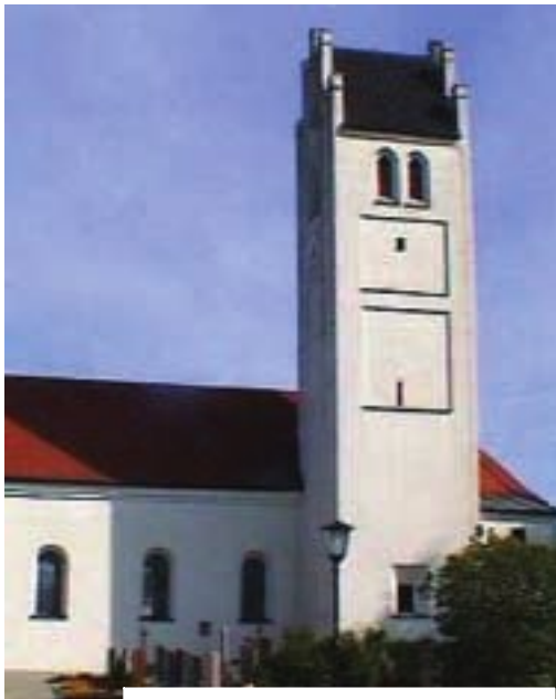
Kollbach, St. Martin

Die Pfarrkirche ist ein langer, nüchterner, fünfschiger Saalbau, der 1889 erweitert wurde, mit leicht eingezogenem gotischen, einjochigen Altarraum, der in fünf Achteckseiten schließt. Die Fenster hatte man nachträglich vergrößert und die Gewölberippen abgeschlagen. An der Chorsüdseite steht der gotische Turm mit Satteldach. An den Giebeln sind die hohen Zinnen mit schwalbenschwanzähnlichem Abschluss angebracht, die dem Turm sein markantes Aussehen verleihen. Im Erdgeschoss ist hier noch das ursprüngliche Netzgewölbe zu sehen. Die dop-