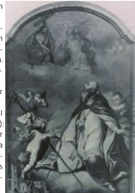
Kollbach, St. Martin. Ehemaliges Hochaltargemälde