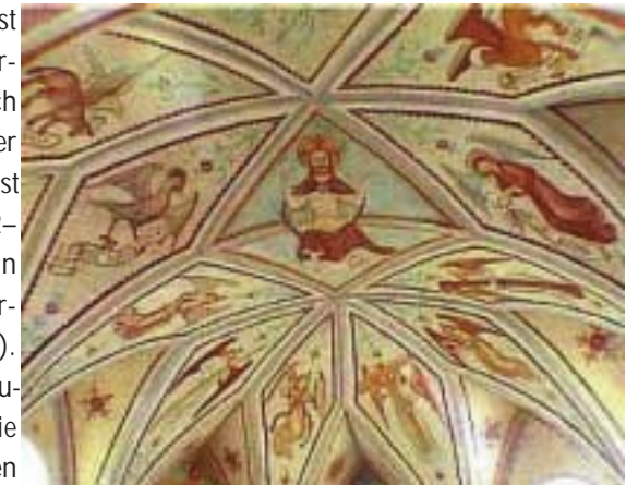
Glonnbercha, Mariä Verkündigung. Deckenfresko im Chor