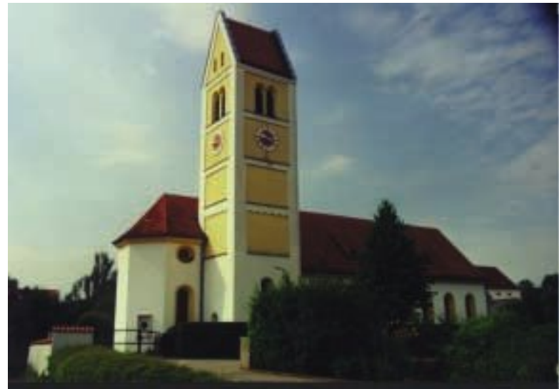
Petershausen, Pfarrkirche St. Laurentius