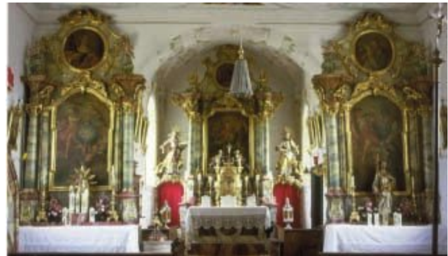
Asbach, St. Peter und Paul. Innenansicht

An Skulpturen finden wir gegenüber der Kanzel ein Kruzifix, wohl noch aus dem 17. Jh., und eine Schmerzhafte Muttergottes. Die Südwand im Langhaus ziert der hl. Johannes Nepomuk, Mitte des 18. Jh.,