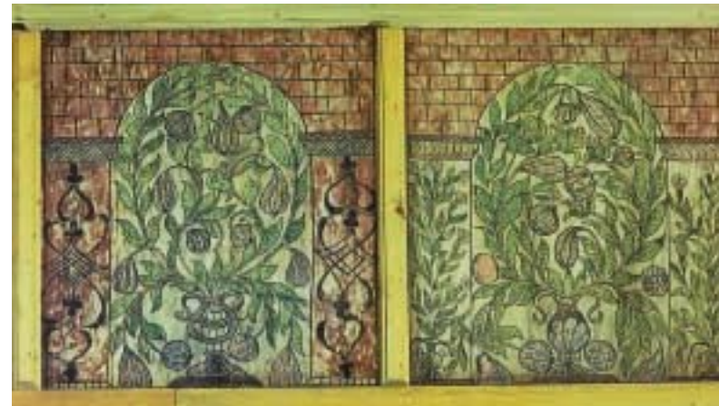
Glionbercha, Mariä Verkündigung. Emporenbrüstung