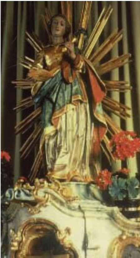
Weißling, St. Notburga. Altarfigur

Die einfache Ausstattung wird im Chor durch ein reich gestaltetes schmiedeeisernes Gitter aus dem 19. Jh. abgeschlossen. Das Zentrum