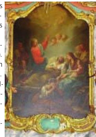
Lindach, Hauskapelle. Altargemälde