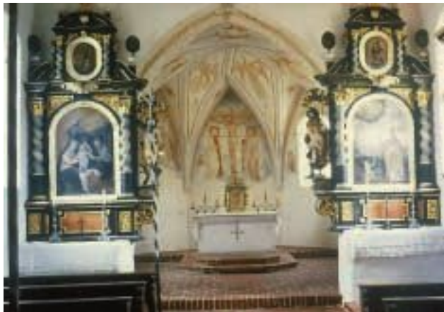
Glionbercha, Mariä Verkündigung. Innenansicht

Der ehemalige Hochaltar steht seit der Kirchenrestaurierung an der Langhaussüdseite und bildet als hochbarockes Retabel (Altaraufsatz) aus der Zeit um 1700 mit den beiden Seitenaltären eine stilistische Einheit. Die Mitte des Altares ziert Maria mit Kind auf dem linken Arm, in der Rechten eine Weltkugel mit Kreuz haltend, wonach das