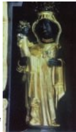
Kollbach, Frauenkirche. Schwarze Madonna

sonders reich gearbeitet mit üppigem Schnitzwerk an den Pilastern und Feldern. Das Laiengestühl stammt ebenfalls aus der Barockzeit.